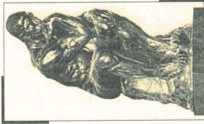
A. Rodin - Il Pensatore

“FILOSOFIA E SCIENZA: CONTRASTO O ACCORDO?”