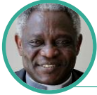
Cardinal PETER TURKSON Prefect, Dicastery for the Promotion of Integral Human Development, Vatican City