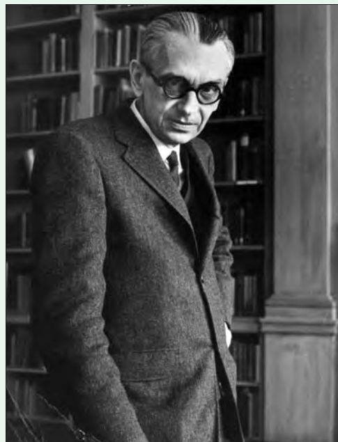
Kurt Gödel (1906-1978)