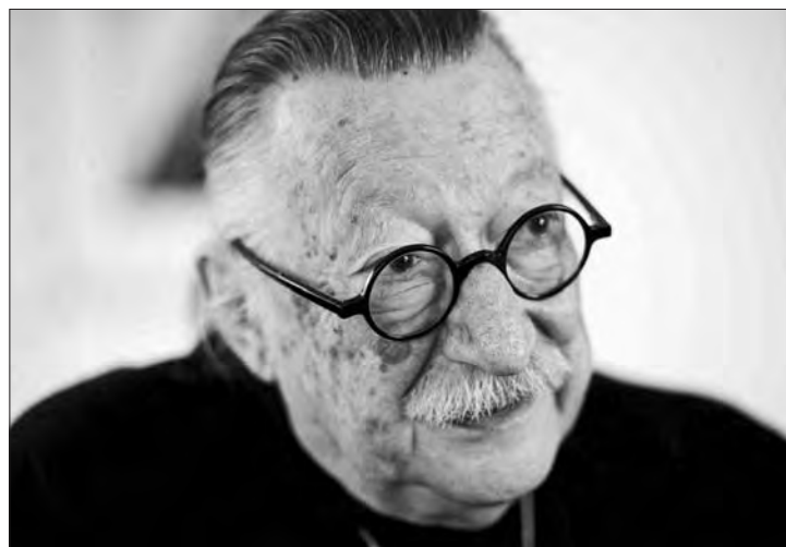
FIGURA 3 Joseph Weizenbaum (1923-2008)

Di parere contrario era invece il chimico, filosofo ed economista di origine ungherese Michael Polanyi (1891-1976), il quale osservò che una macchina è una macchina e una mente umana è una mente umana e non c’è dato dell’esperienza che possa cambiare questo a priori . Polanyi tuttavia non chiarì la distinzione tra macchina e mente umana, che è il nocciolo di tutta la questione: se restiamo alla superficie, tutto sembra chiaro, ma se spingiamo le argomentazioni a fondo cominciano le difficoltà. Ciò ricorda quanto sant’Agostino diceva del tempo: “Se non me lo chiedi so che cos’è, se me lo chiedi non lo so più”. Questo fenomeno di presbiopia cognitiva riguarda anche la lingua: se ci si accontenta di una certa vaghezza legata al buon senso e all’uso ordinario va tutto bene, ma se si vuol tener conto di tutte le accezioni ed eccezioni linguistiche e definitorie si finisce nei