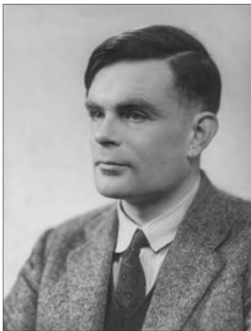
FIGURA 1 Alan Turing

più caratteristiche. Era importante possedere un criterio se non per definire l'intelligenza, almeno per riconoscerne la presenza sia negli organismi biologici sia negli artefatti. Non dimentichiamo che erano gli anni della cibernetica , una disciplina che si proponeva, secondo il programma del suo fondatore Norbert Wiener, di studiare in modo unificato "la comunicazione e il controllo nell'animale e nella macchina". Di lì a poco, nel 1956, per iniziativa del ma-