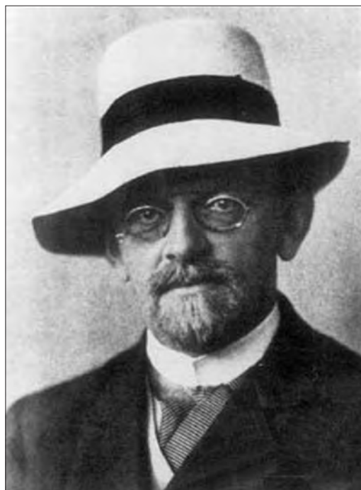
FIGURA 2 David Hilbert (1862-1943)

C'è dunque un certo grado di confusione. Da una parte Turing riconosce che l'intelligenza dell'uomo deriva dalla sua interazione con il mondo e quindi dal suo equipaggiamento corporeo, che è il tramite che consente quell'interazione. Dall'altra emerge la convinzione che la macchina a stati discreti, la cosiddetta “macchina di Turing” (riquadro 2 a p. 16, 17), possa usare le parole in modo umano, al punto da ingannare l'esaminatore, senza essere dotata di organi di senso e di organi effettori che le consentano di interagire con la realtà esterna. Il gioco dell'imitazione si basa sull'interazione linguistica, dunque su un segno esteriore del pensiero, che è inaccessibile. In questo senso è un criterio comportamentistico. Le sequenze verbali sono lì a manifestare la propria esistenza, mentre il pensiero, da cui (forse) scaturiscono, ha uno statuto esistenziale molto più dubitoso e, a quei tempi, nella prima metà del Novecento, era bandito dalle riflessioni di psicologi e filosofi. Turing accetta dunque in pieno la posizione comportamentista allora imperante. Ma nell'accettarla egli non nega l'esistenza del pensiero, anzi con-